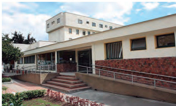
• Entrada principal del Hospital

En la Fundación Universitaria de Ciencias de la Salud (FUCS) se definió como objetivo prioritario contar con un segundo hospital para asegurar lugares idóneos para la práctica de sus estudiantes, con la infraestructura, dotación y recurso humano suficientes para los procesos educativos. Dentro del análisis del entorno se encontró la opción de adquirir una entidad y rehabilitarla, lo que permitiría acelerar su puesta en marcha, en comparación con la compra de un terreno y la construcción de un nuevo hospital. En el mes de julio del año 2005 se realizaron los primeros acercamientos del Presidente del Consejo Superior de la FUCS con el ente liquidador de la Fundación Hospital Infantil Lorencita Villegas de Santos para la negociación de la compra de los predios del antiguo Hospital, la cual culminó en diciembre de ese mismo año (2005) con la firma de la escritura pública correspondiente.