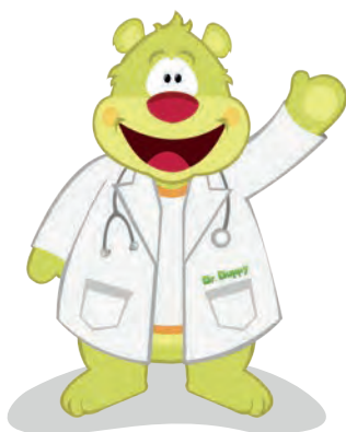
• Dr. Duppy, mascota institucional

En el futuro próximo, el Hospital espera poder ofrecer nuevos servicios hospitalarios y nuevos equipos de apoyo diagnóstico de última generación. De esta manera se espera fortalecer aún más los espacios de práctica y el número de estudiantes de pre y posgrado en el Hospital, para consolidar la Fundación Universitaria de Ciencias de la Salud, hoy de enorme reconocimiento en el medio académico nacional.